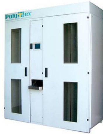
D-10 Dağıtım Ünitesi