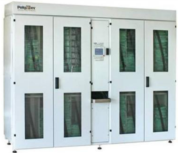
D-16 Dağıtım Ünitesi