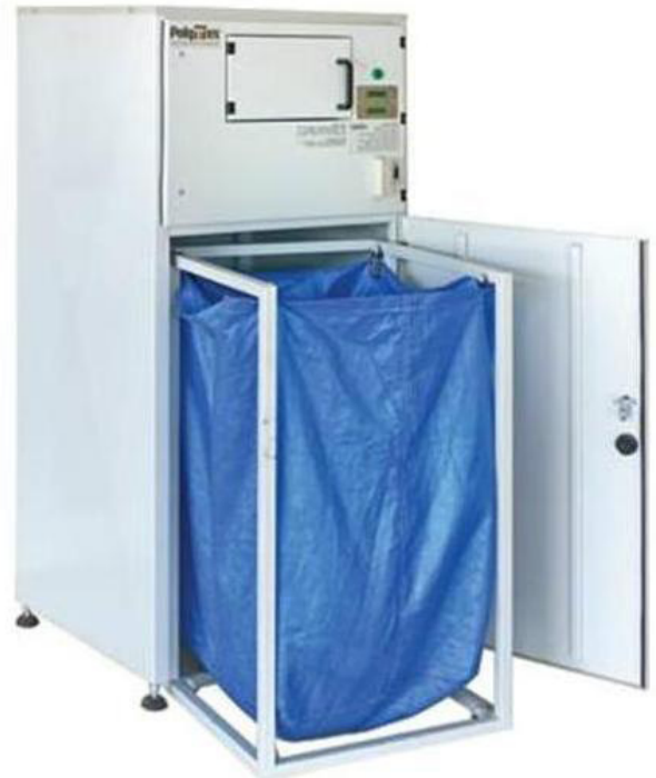
R-100 Toplama Ünitesi