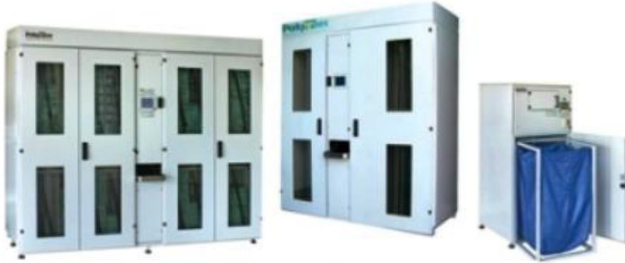
D-16 Dağıtım Ünitesi